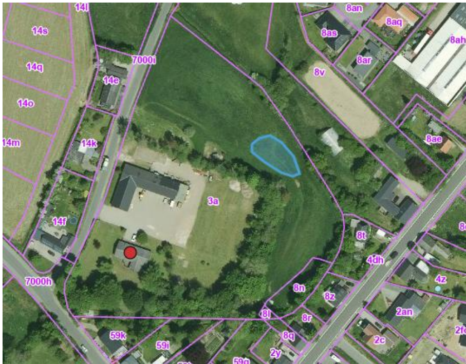
Kortbilag 1. Af kortudsnittet fremgår søens omtrentlige placering samt størrelse (blåt polygon).