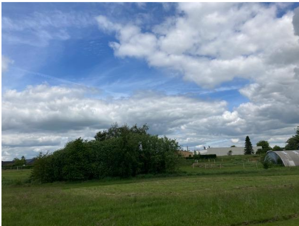
Billedbilag 2. Af billedet fremgår det område, hvor søen ønskes placeret.