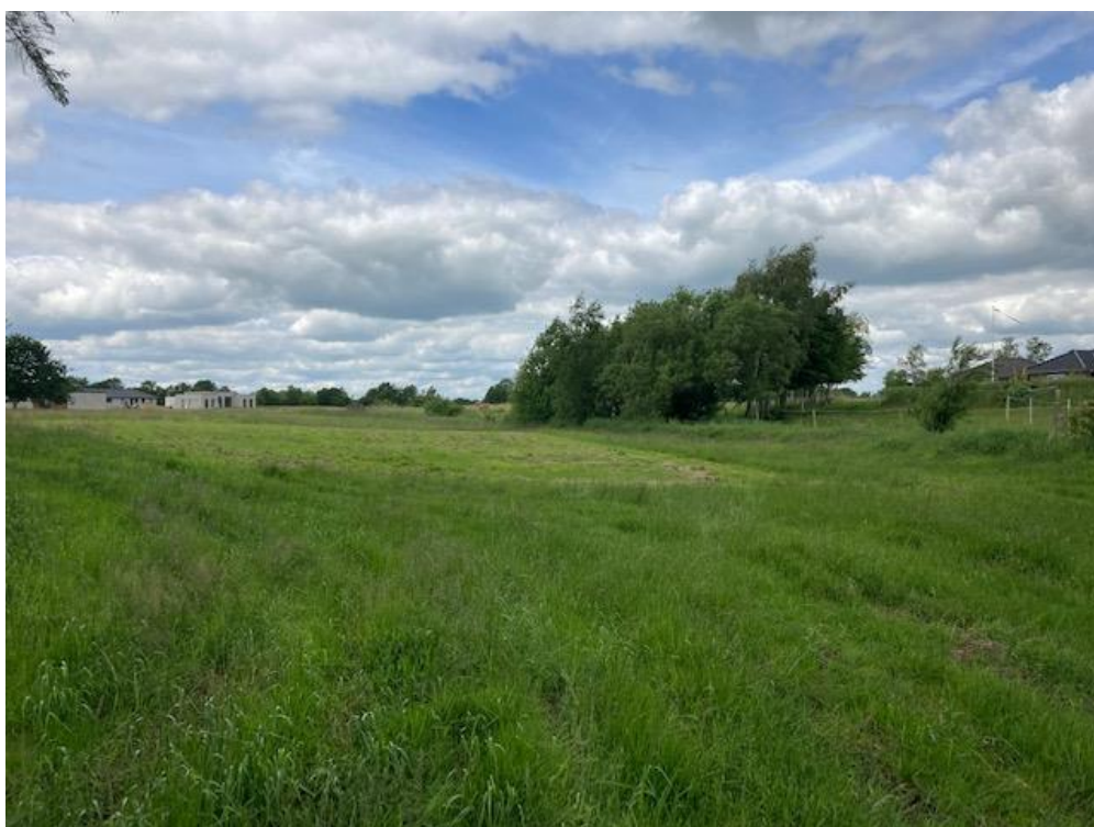
Billedbilag 1. Af billedet fremgår det område, hvor søen ønskes placeret.