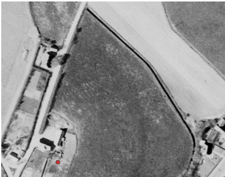
Kortbilag 2. Luffoto fra 1954. Det ses, at arealet ikke er opdyrket.